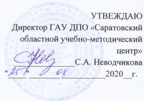
ГРАФИК УЧЕБНОГО ПРОЦЕССА по дополнительной профессиональной программе (программе повышения квалификации) «ЦИФРОВЫЕ ТЕХНОЛОГИИ В СОВРЕМЕННОЙ ОБРАЗОВАТЕЛЬНОЙ СИСТЕМЕ» 2020/2021 учебный год

Государственное автономное учреждение дополнительного профессионального образования в сфере культуры и искусства «Саратовский областной учебно-методический центр» (ГАУ ДПО «Саратовский областной учебно-методический центр»)