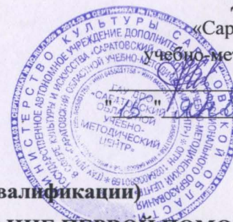
ГРАФИК УЧЕБНОГО ПРОЦЕССА

по дополнительной профессиональной программе (программе повышения квалификации)